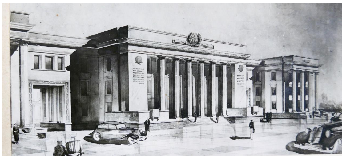
3. Бинои Маҷлиси Олӣ (давраи пеш аз истиқлол)

Дар замони истиқлол низ чунин анъана ва рушди касби санъати тасвирӣ бо маром идома дода шуда, аз тарафи рассомони кишвар,